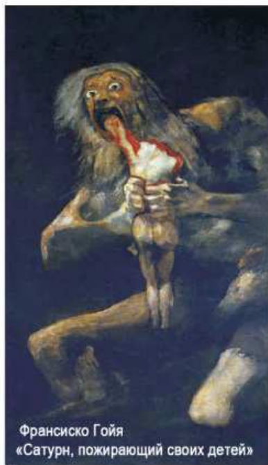
Франсиско Гойя «Сатурн, пожирающий своих детей»

Разве Господь во все времена не истреблял творящие мерзость народы и не отдавал их земли во владение чужим племенам?... Если мы не остановимся, то долготерпение Божие кончится, и гнев Его разразится над нами.