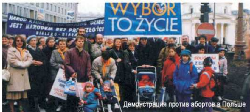
Демонстрация против абортов в Польше

Теперь аборт в Польше запрещены. Так захотел народ, и правительство выполнило его волю. Вопреки запугиваниям со стороны защитников детоубийств, с 1993 года (года запрета) последовала только одна смерть женщины от нелегального аборта, при том, что от «легальных» абортов гибнет в сотни раз больше. В то же время, в стране улучшилось репродуктивное здоровье женщин, сократились материнская и детская смертности*.